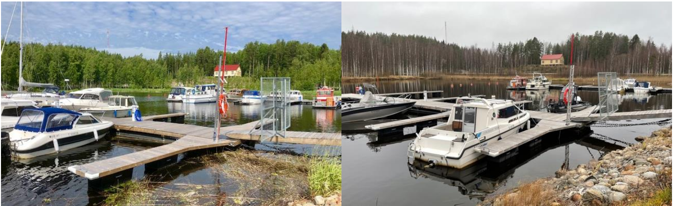
Värimaailma Suopellosa on muuttunut ja on viimeinen hetki nostaa veneet talviteloille.